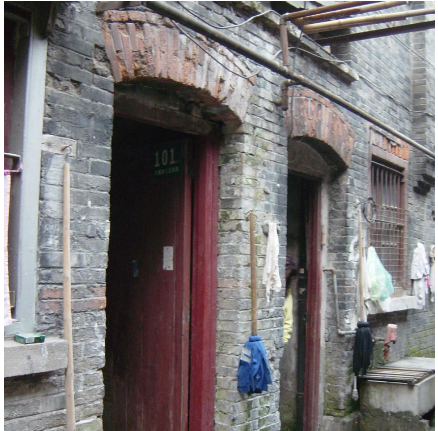
↑旧外国人租界（上海）